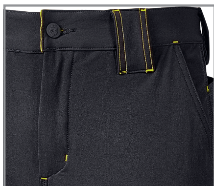
Elastico in vita