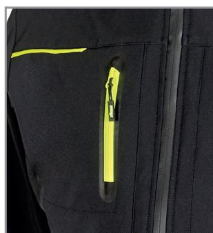
Tasca porta cellulare