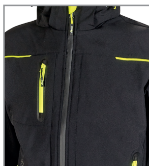
Inserti in reflex