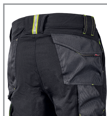
Tasche posteriori laterali inclinate