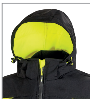
Cappuccio a scomparsa