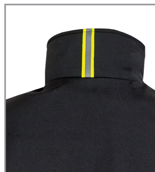
Nastro reflex su colletto