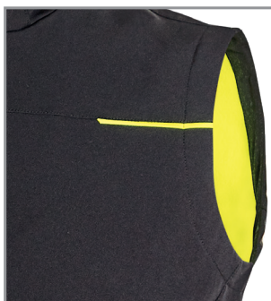
Inserti in reflex