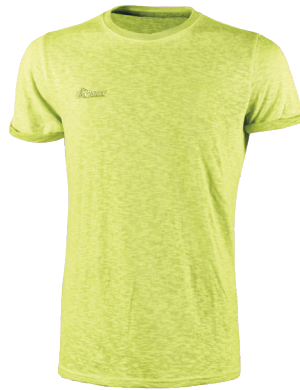
code EY195YF col. YELLOW FLUO