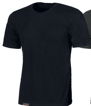
code EY205DB col. DEEP BLUE