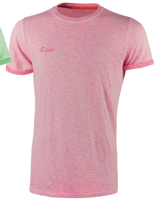
code EY195PF col. PINK FLUO