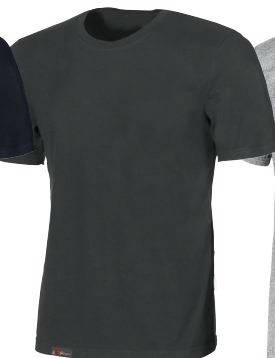
code EY205GM col. GREY METEORITE