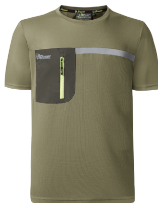
code FU248BO col. BURNT OLIVE