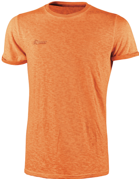
code EY195OF col. ORANGE FLUO