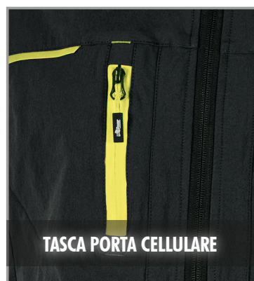
TASCA PORTA CELLULARE