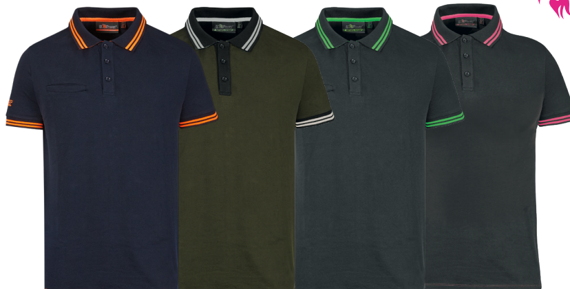
code EY264DB col. DEEP BLUE