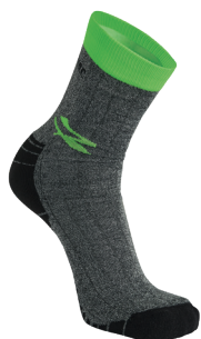
code SK218VF col. VERDE FLUO

47% POLIESTERE • 12% POLIAMIDE • 39% COTONE • 2% ELASTANE