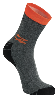
code SK218OF col. ORANGE FLUO

» Calza tecnica sviluppata in taglia unica con tecnologia "Memory size".