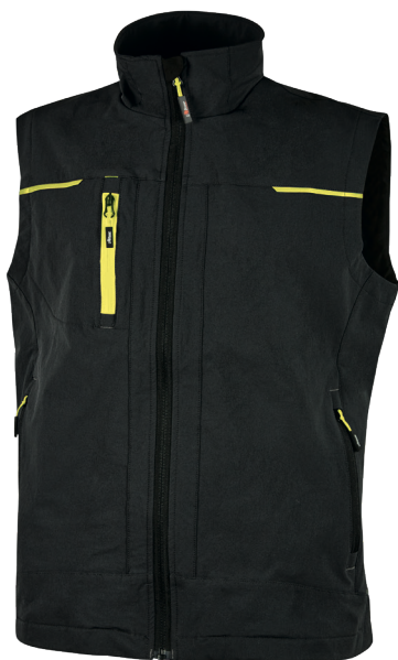
code PE181BC col. BLACK CARBON