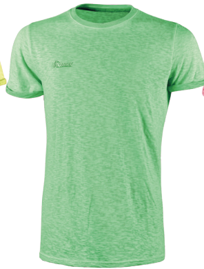
code EY195VF col. VERDE FLUO