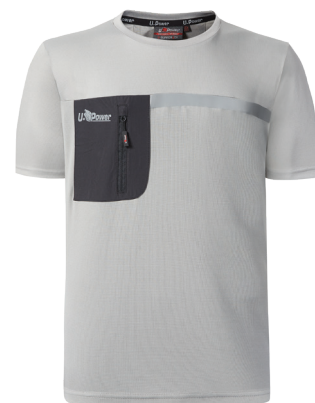
code FU248LS col. LIMESTONE