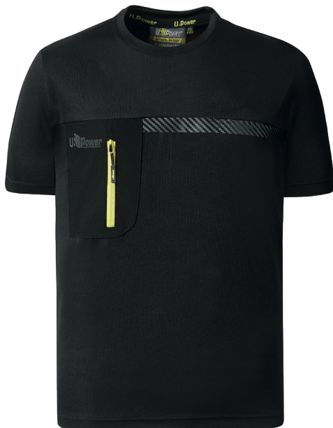
code FU248BC col. BLACK CARBON