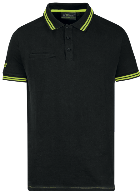
code EY264BC col. BLACK CARBON