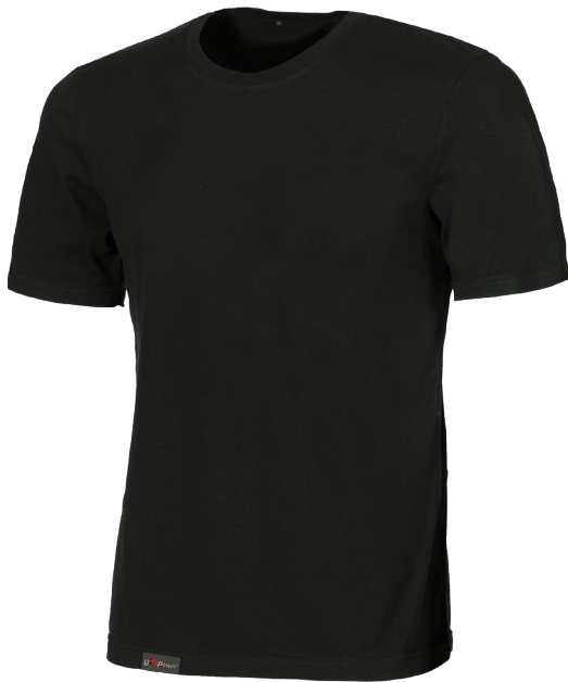
code EY205BC col. BLACK CARBON