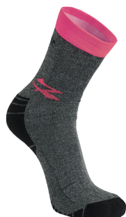
code SK218GF col. GREY FUCSIA