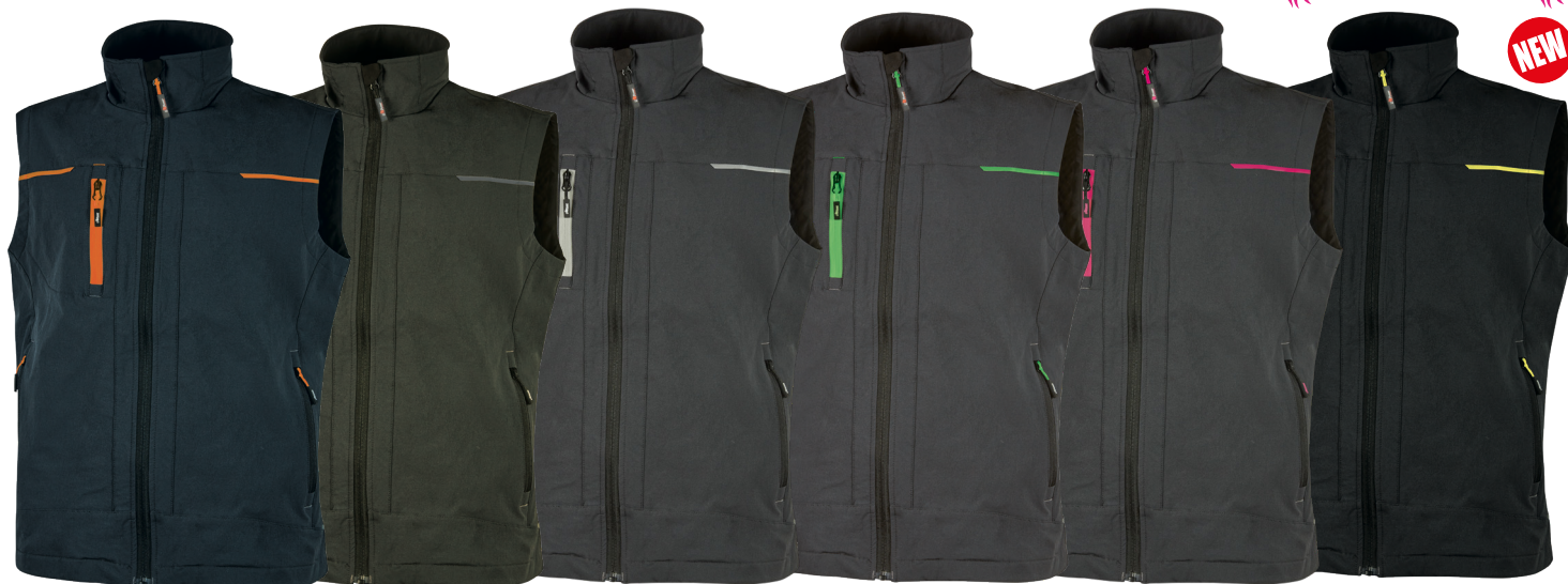
code PE181DB col. DEEP BLUE