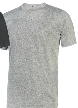
code EY205GS col. GREY SILVER